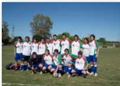
• El grupo de alumnos del IUNIR, listos para salir a la cancha.