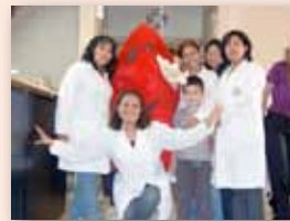
• ¡Voluntarios y profesionales, a pleno durante la jornada!

cuencia de donaciones realizadas por cada persona y se tuvo como resultado que la mayoría de las unidades obtenidas en las Jornadas provenían de donantes habituales que se acercaron movidos por el deseo de ayudar a quienes lo necesitan.