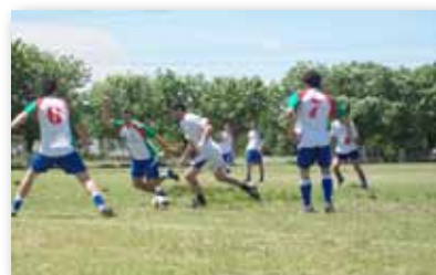
• Los chicos en pleno partido.

Sobre el mediodía, terminadas las actividades deportivas, se realizó una ceremonia de premiación que contó con la presencia de autoridades de las cuatro casas de altos estudios.