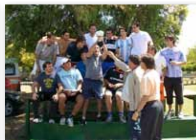
• Los alumnos durante la ceremonia de premiación.