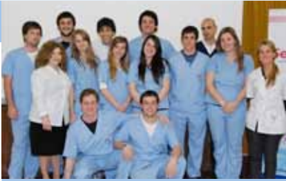
Charla informativa: 7 de diciembre - 19 hs. - IUNIR.

La Escuela de Odontología del IUNIR ya abrió la inscripción para el año 2011. Con sede en el IUNIR y la cooperación del Círculo Odontológico de Rosario (COR), este proyecto se propone seguir creciendo y sumando para la formación de profesionales de excelencia. Entre las características que distinguen a la carrera, se destacan: