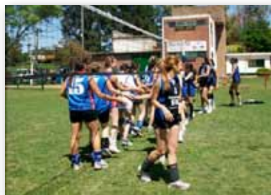
• Las chicas a punto de comenzar el partido de volley.